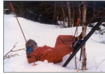
August 1983 - Juni 1986 Valle Ungdomsskule