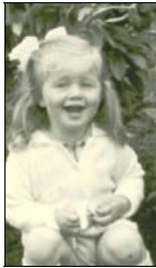
Fødd 5 februar 1971