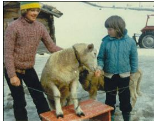
August 1977 - Juni 1983 Valle Barneskule